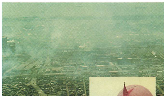
昭和43年「川崎市」④ バルーン上空調査⑥